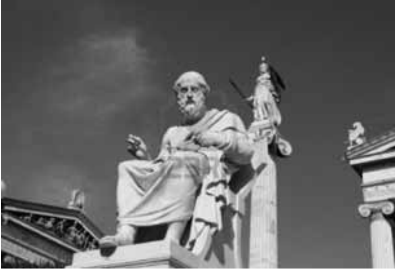
Neo-klassiek standbeeld van Plato in Athene.

is er toch niet alleen sprake van twee niveaus – de ondergrondse grot en de bovengrondse wereld van de zon? Er is volgens mij ook nog een tussenniveau: de trap. Hoe zit dat dan precies?