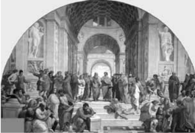
Op zijn schilderij 'De school van Athene' (1510) beeldde Rafaël de filosofen Plato en Aristoteles in het midden af.

'Ik heb hierdoor ontdekt – en dat is een belangrijk aspect van mijn pedagogiek geworden – dat wijsheid niet vrij toegankelijk is. Zij is toegankelijk voor wie haar oprecht zoekt. Daarom moet zij zichzelf soms verhullen. Haar vorm is daarom – wanneer we raken aan de diepste kern van het kennen – niet meer die van een betoog of discours. Dan neemt de wijsheid de vorm van de allegorie aan. Haar betekenis onthult zij slechts in het gesprek over en weer, zoals we dat nu hebben, en niet in een monoloog, en al helemaal niet in manipulatie door middel van een woordenspel. De waarheid onthult haar geheim wanneer zij die ernaar verlangen van aangezicht tot aangezicht tegenover elkaar staan. Daarom schrijf en spreek ik slechts in allegorieën of in dialogen – dat zijn de verhullende vormen van het geheim.'